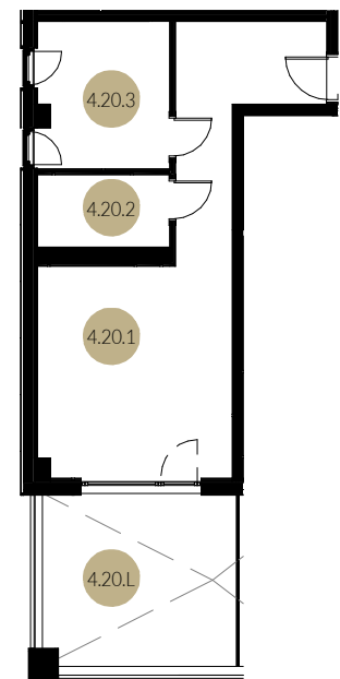
RZUT LOKALU W STANIE DEWELOPERSKIM